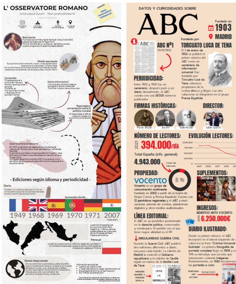
Figura 2: Ejemplos de infografías realizadas por los/as estudiantes durante el curso 2020/2021 sobre los diarios L'Osservatore Romano y ABC

Los estudiantes han llevado a cabo un minucioso proceso de análisis de las opciones existentes y han seleccionado cuidadosamente el medio de comunicación sobre el que querían realizar la infografía. En numerosas ocasiones, antes de realizar su elección, han consultado al profesor para plantear la viabilidad de su propuesta en torno a la aplicación online por la que se habían decantado para la realización del ejercicio. Además del resultado final (infografía), el aspecto más positivo del ejercicio ha sido, sin duda, la fase de documentación previa a la estructuración de la información y del diseño. En este apartado, los estudiantes han acudido a todo tipo de fuentes para recabar la