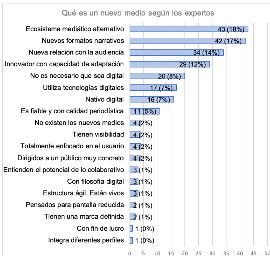
Figura 2: Descripciones más citadas por los expertos (elaboración propia)

En las respuestas de los expertos, se advierte un alto grado de coincidencia a la hora de mencionar características asociadas a seis elementos: 1) estructura (muchos expertos coinciden en señalar que los nuevos medios conforman un ecosistema propio, distinto del de los medios tradicionales; 2) tecnología (muchos subrayan el carácter digital como elemento distintivo, si bien otros lo niegan; en cualquier caso, ambos grupos consideran el aspecto tecnológico como un criterio relevante); 3) forma (se destaca la importancia del uso de las nuevas narrativas y la elevada adaptación de los nuevos medios a los dispositivos avanzados); 4) relación con la audiencia (caracterizada por una alta interactividad y una clara orientación al usuario); 5) organización interna (combinación de múltiples perfiles profesionales, con estructuras ágiles); y 6) calidad del contenido (se subraya que el contenido de los nuevos medios es distintivo y de alta calidad).