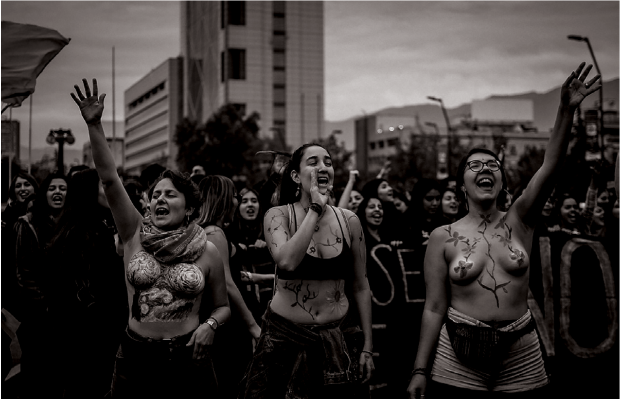
▪ Marchas feministas en Chile por la igualdad y seguridad de las mujeres, diciembre del 2018

inmediata o “natural”, porque, para ella, la valencia diferencial de los sexos es un artefacto y no un hecho de la naturaleza.