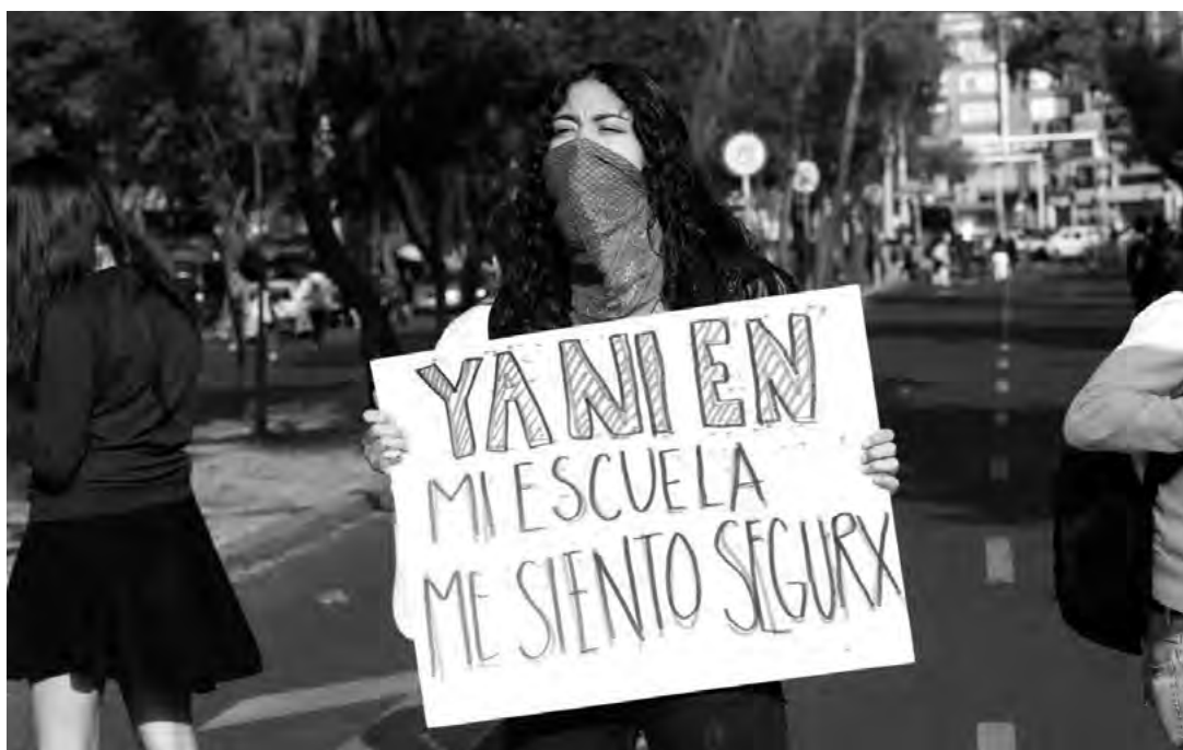
▪ Marcha contra el acoso sexual en escuelas y universidades, México 2019

Dicha alteración representa una respuesta de las mujeres respecto de los lugares y papeles sociales que deberían cumplir según las definiciones más corrientes de feminidad, y marca un fuerte contraste con las que Mirra Komarovsky describió hace casi 75 años en un informe de investigación con alumnas de último año de licenciatura en universidades de Estados