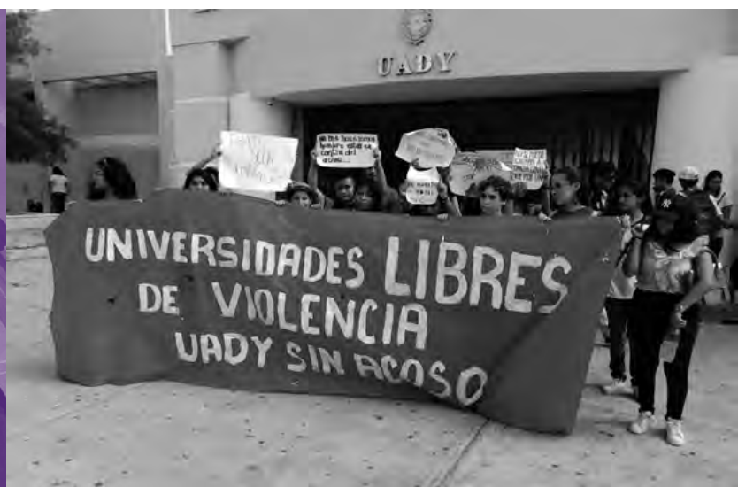
▪ Estudiantes de la Universidad Autónoma de Yucatán marchan contra el acoso y el abuso sexual en la institución, México, junio del 2019