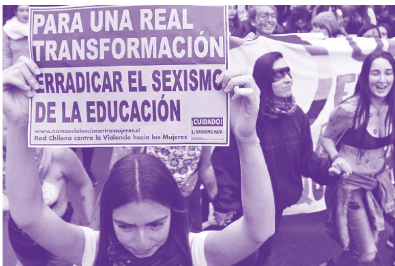
▪ Marchas feministas en Chile por una educación no sexista, mayo del 2018

Consideramos la misoginia y el sexismo como mecanismos de imposición del orden de género. Es evidente que dicha imposición no necesita recurrir al ejercicio de la fuerza bruta en todas sus instancias; como dice Kate Manne, “se supone que las relaciones sociales patriarcales son amigables y continuas, cuando todo sale según el plan. Es sólo cuando las cosas se desvían que la violencia tiende a burbujear en la superficie” (2018: 76). Y Kate Millet ya había escrito en su libro decisivo sobre política sexual: