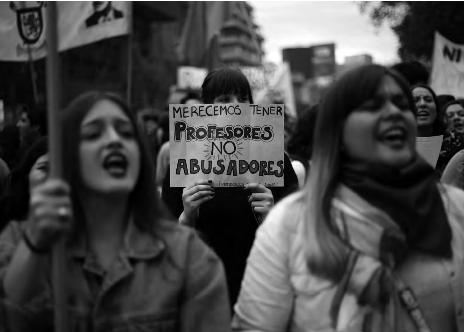
▪ Marcha de estudiantes universitarias chilenas por una educación no sexista, Santiago, 2018