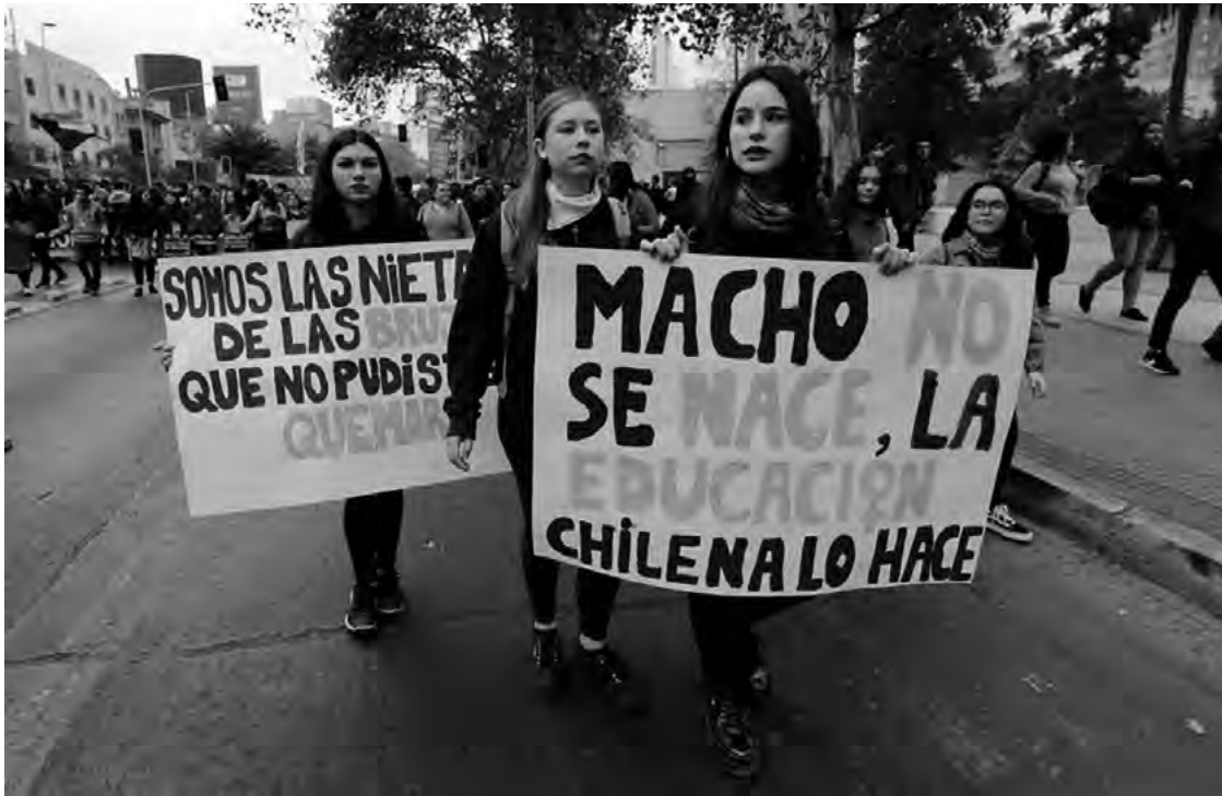
▪ Marcha de estudiantes universitarias chilenas por una educación no sexista, Santiago, 2018

da habitualmente, de modo que la mecánica que liga la otredad (lo femenino) con la atracción, el peligro, la subordinación y el desprecio posiciona a las mujeres en el lugar del objeto, lo cual, como dice Martha Nussbaum (1995), siempre es moralmente un problema pues objetualizar a alguien consiste en verlo o tratarlo como si fuera una cosa.