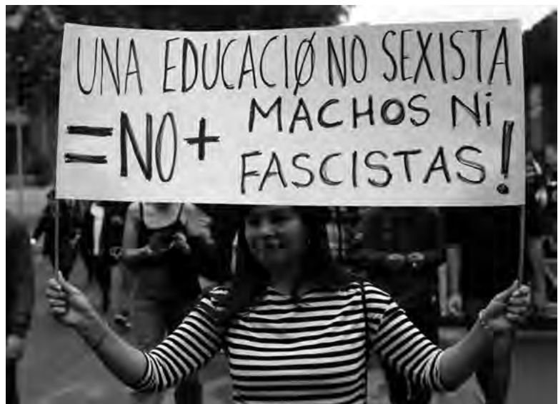
▪ Marcha de estudiantes universitarias chilenas por una educación no sexista, Santiago, 2018

Del testimonio anterior queremos subrayar ya no la estupidez del docente o su dudoso sentido del humor, sino el intento de traducir “pedagógicamente” sus lamentables ideales en una normatividad “con bases científicas”, y la pedestre estrategia de comparar a las mujeres con animales, que veremos repetirse hasta la saciedad en innumerables circunstancias –por ejemplo: “Señorita, ¿qué hace con ese escote? ¿Usted vino a dar una prueba oral o a que la