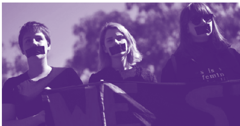
■ Estudiantes de la Universidad Nacional Australiana en protesta contra el acoso sexual a estudiantes, Canberra, 2016

En la vida estudiantil de muchas universidades encontramos instancias de estas disposiciones y posicionamientos en diferentes testimonios recogidos tanto en nuestro trabajo de campo como en expresiones de protesta mediante redes sociales y noticias periodísticas. Lo interesante de estas declaraciones públicas de hartazgo, descontento y malestar es que ilustran, por un lado, una enorme variedad de estrategias de significación –o actos performativos– cuya fuerza ilocucionaria consiste en la imposición de la supremacía varonil en interacciones concretas y encarnadas 9 .