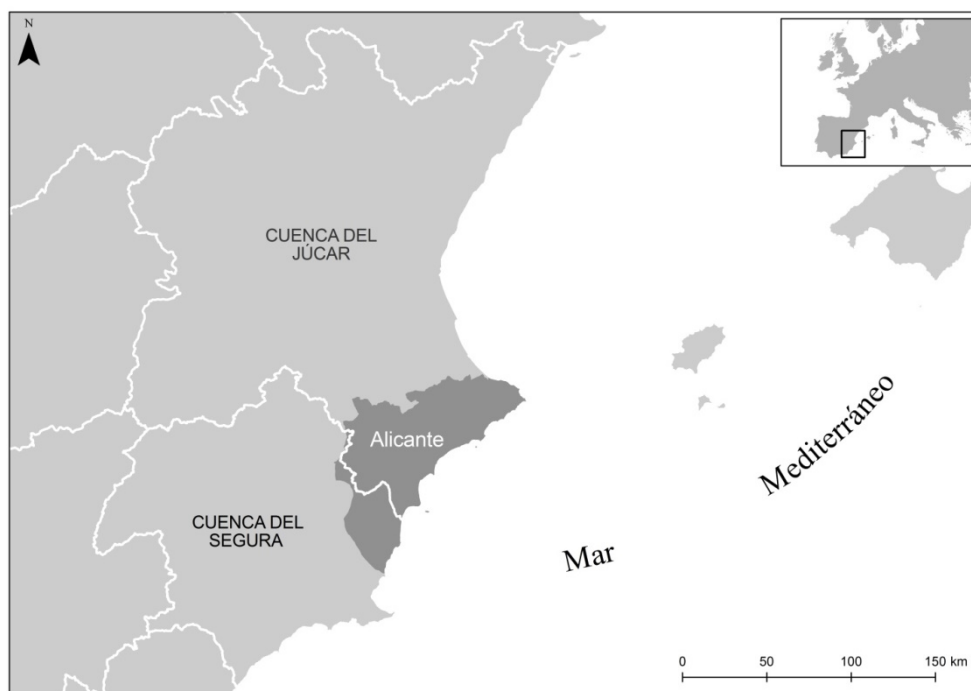
Figura 1. Área de estudio. Provincia de Alicante

2) Cambios en la estacionalidad de las precipitaciones; y 3) Incremento en la irregularidad de las precipitaciones, lo que llevaría consigo un aumento de eventos extremos (sequías y lluvias de fuerte intensidad horaria). En las tres últimas décadas se ha registrado ya una reducción a las aportaciones medias anuales ( \text{hm}^3/\text{año} ) en todas las demarcaciones hidrográficas españolas. Comparando datos de aportación media entre 1996–2005, en relación con los valores medios del período 1940–1995, esta disminución se eleva al 14,3 % para el conjunto del país, con valores más altos de esta reducción, por encima del 20 %, que se corresponden con las cuencas hidrográficas situadas en la mitad sur peninsular y el litoral mediterráneo (Valdés et al., 2017). Además, se ha observado también un cambio en el patrón estacional de las lluvias que, está provocando una disminución de días de lluvia al año y una concentración mayor en otoño en detrimento de la primavera (las dos únicas estaciones del año lluviosas en el sureste ibérico). Las consecuencias de este cambio se acentúan por el hecho de que las primeras, en las regiones del litoral mediterráneo, son poco aprovechables, torrenciales pero súbitas y no almacenables (Olcina, 2016).