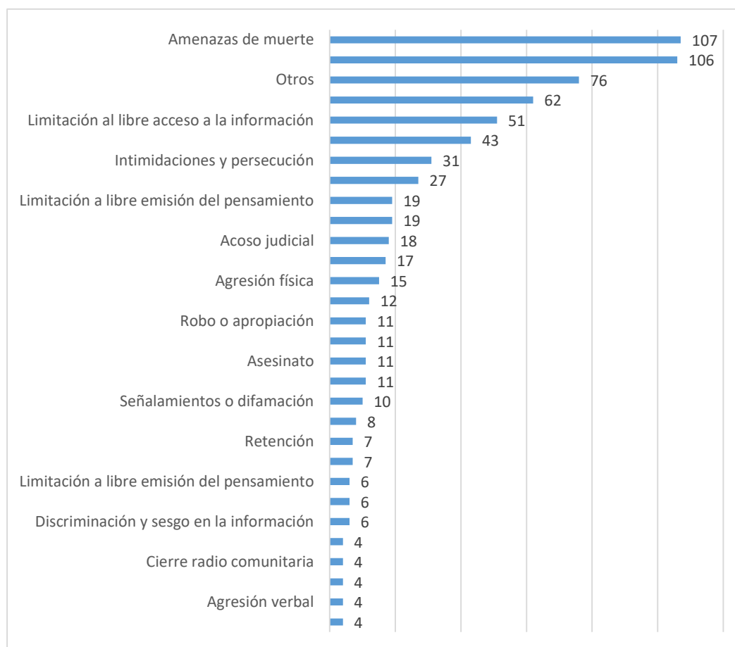
Gráfico 1. Agresiones a periodistas en Guatemala (2003-2017)

*Dada la cantidad de agresiones, se han suprimido del gráfico aquellos tipos que solo tenían una o dos agresiones en el compito total.