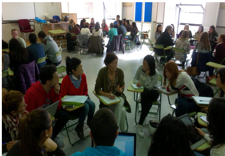
Secuencias para el tránsito por los grupos:

Veamos una foto de una de las sesiones (fig. 1) y uno de los planos que se les entrega a nuestras visitas (que son quienes rotan en nuestra organización), con la secuencia que cada cual ha de seguir por los diferentes grupos (fig. 2).