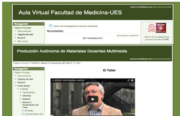
Figura 4. Vista del curso en la plataforma Moodle de la Facultad de Medicina de la U. de El Salvador

Se respetó el diseño instruccional del MOOC basado en “learning by doing” concretado en una serie de tareas para cuya realización los participantes contaban con diferentes videotutoriales elaborados por el equipo docente del MOOC.