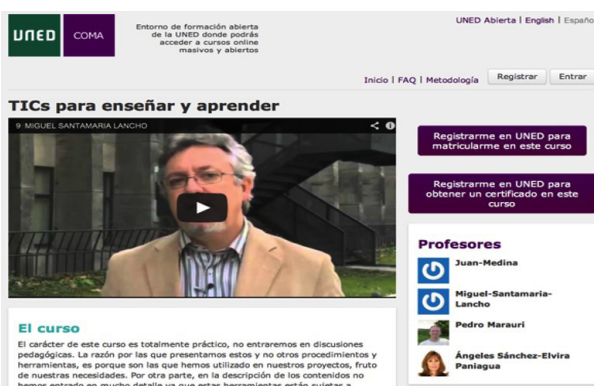
Figura 3. Vista del Curso COMA en la plataforma de Cursos Abiertas de la UNED.

Para llevar a cabo la experiencia formativa en primer lugar se montaron los contenidos del curso COMA en la plataforma Moodle de la Facultad de Medicina de la Universidad de El Salvador, con el de facilitar el acceso a los contenidos a través de un medio conocido por los participantes