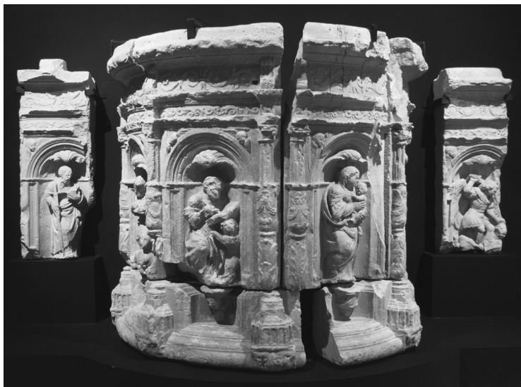
1. Pulpito

Poco a poco, a lo largo de la centuria del quinientos, los diferentes maestros que intervienen van introduciendo, aún manteniendo la unidad estilística del templo, el nuevo estilo renaciente, tanto en los motivos ornamentales como en la estructura arquitectónica.