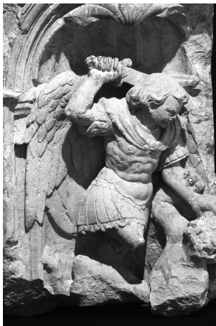
5. San Miguel

La figura de San Pedro, situada en la actualidad a la izquierda de la Virgen, presenta una iconografía fácilmente identificable. Hombre de edad avanzada, con acusada calvicie. Viste amplia túnica y manto. Con la mano izquierda sujeta un libro cerrado que apoya en su costado. En la mano derecha sostiene de manera ostensible una gran llave, su atributo más característico y constante. Mediante la llave se hace referencia al papel conferido por Cristo al príncipe de los apóstoles, simbolizando el poder de atar y desatar, de absolver y excomulgar. Aunque aquí San Pedro porta una única llave, normalmente son dos juntas porque el poder de abrir y de cerrar es uno sólo 13 [4].