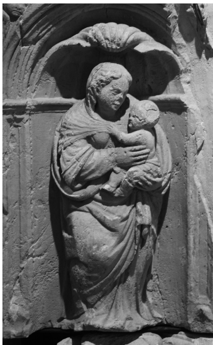
3. Virgen María con el Niño (fotografía de Antonio Aguayo)

La figura de María se halla cobijada bajo una venera, cuyo interior se encuentra más decorado que las de sus compañeros, con unas ondulaciones que recuerdan las ondas marinas, queriendo remarcar la importancia del motivo. Es sabido que en la época clásica, la venera era atributo de Venus. El cristianismo aprovecha el simbolismo del agua, y se transforma en elemento regenerador, alusivo al agua del bautismo, asimilándose en muchas ocasiones a la Virgen, como vehículo necesario para el nacimiento de Cristo. Aunque la venera se sitúa sobre todas las figuras, es sobre María donde cobra realmente mayor importancia y relevancia.