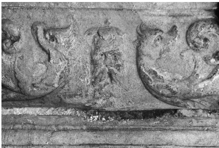
8. Friso de San Miguel

en la que se aprecia una calavera provista de alas, por medio de la cual se está haciendo referencia a la Resurrección, y a la que flanquea la imagen de la Virgen, que se corresponde con la cabeza de un león, símbolo de la vigilancia.