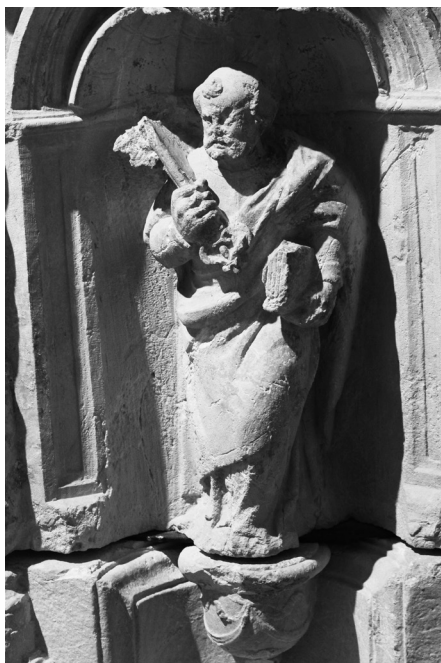
4. San Pedro