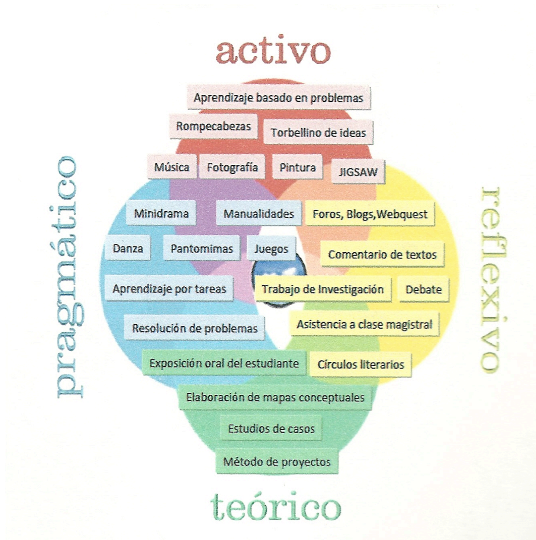
Fig. 13. Distribución de actividades según Estilos de Aprendizaje