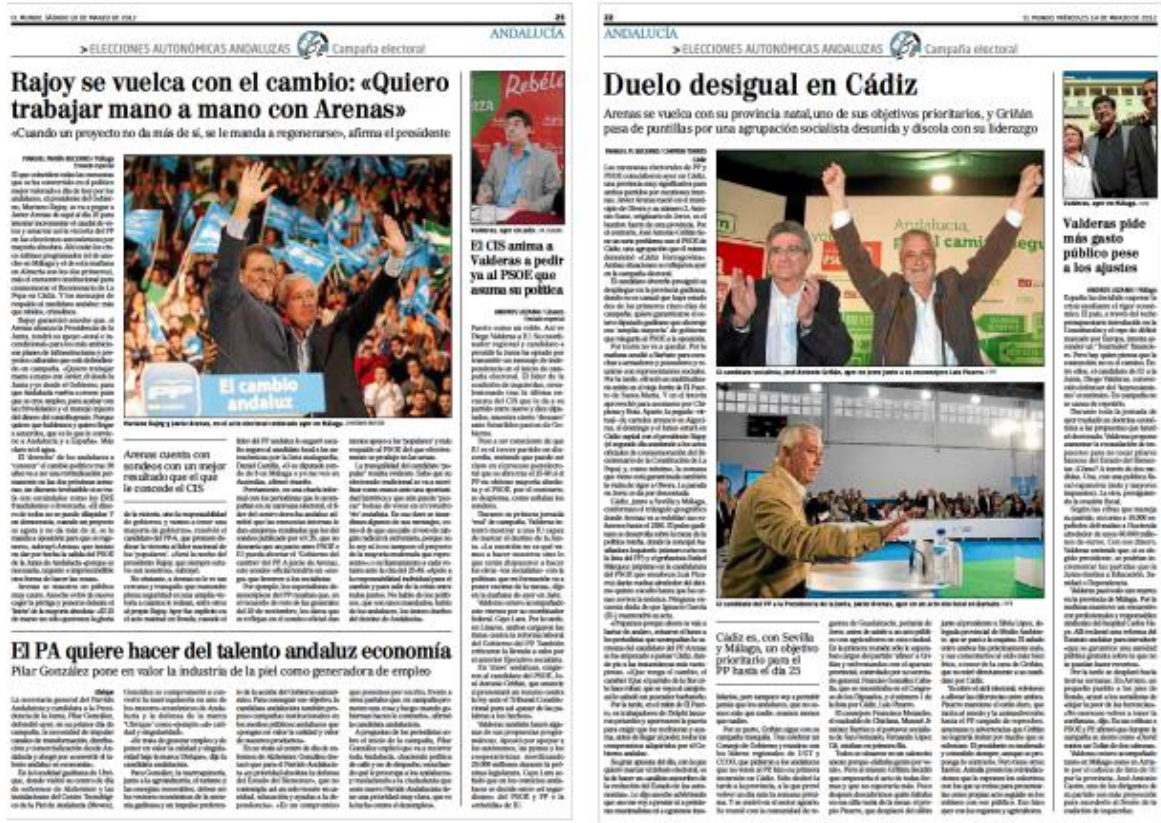
Figura 2. Páginas interiores de El Mundo , 10 y 14 de marzo de 2012

El contraste es menos evidente en el caso de El País , que ofrece instantáneas de los candidatos solos o acompañados casi en idéntica proporción.