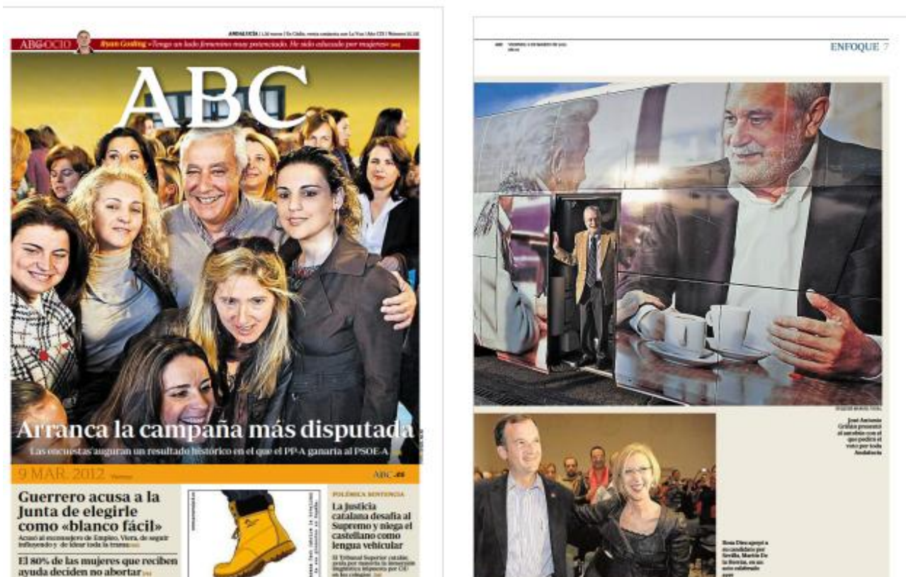
Figura 1. Portada y página interior de Abc , 9 de marzo de 2012.

Las connotaciones de las imágenes tienden a reforzar el discurso predominante de cada cabecera. En Abc , son frecuentes las instantáneas de Arenas rodeado por militantes y simpatizantes ‘populares’ o ante auditorios nutridos (v. gr. la portada del 9 de marzo, o las fotografías que ilustran las crónicas de los días 13, 15, 20 y 24), mientras que Griñán suele aparecer solo o acompañado únicamente por algún dirigente de su partido (así, en la imagen publicada el día de arranque de la campaña, en la que el candidato espera solitario al pie de un autobús, o las de los días 10, 19, 20 y 21 de marzo).