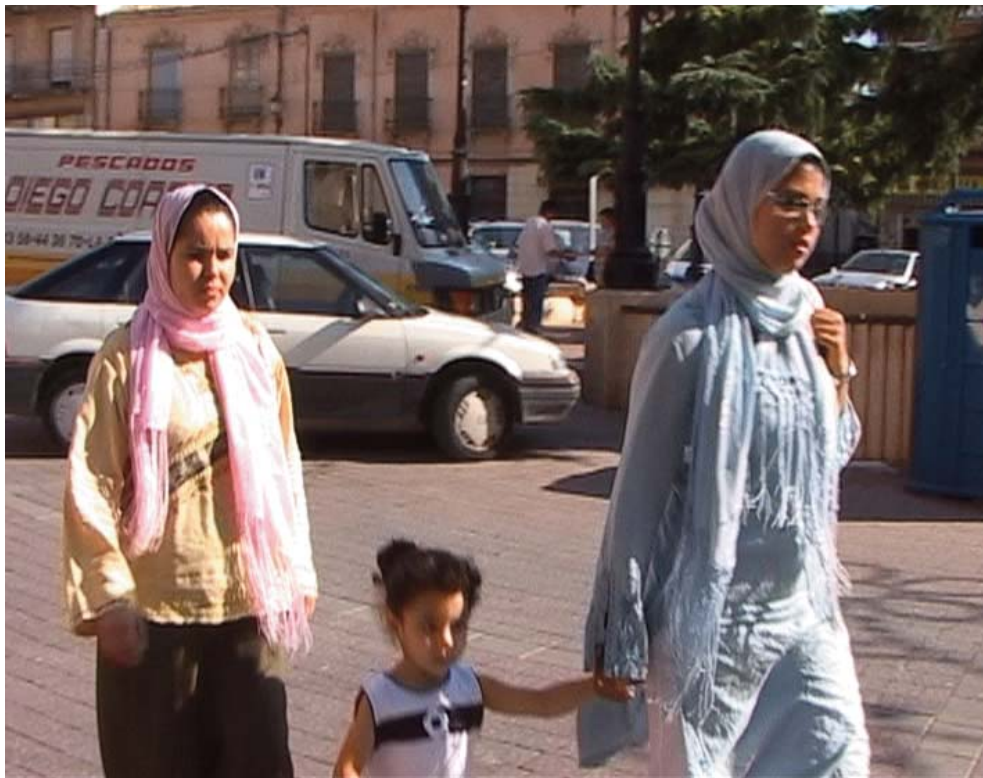
■ SIN RECORTES INMIGRANTES EN CASTILLA-LA MANCHA, ESPAÑA