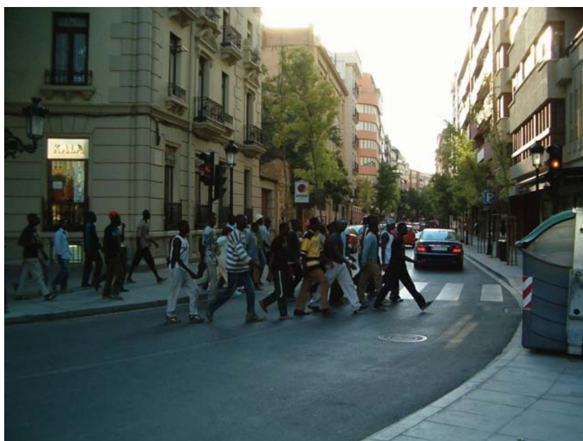
■ ÁFRICA LLORA AQUÍ AFRICANOS QUE MARCHAN A EUROPA