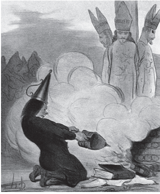
Euripide-Molière-Sofocle H. Daumier in Le Charivari 1851 http://www.payer.de/religionskritik/ karikaturen1.html