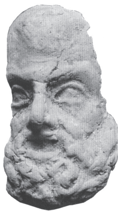
Maschera-ritratto di Sofocle Terracotta Lipari, Mus. Arch. Reg. Eoliano inv. 11553 Bernabò Brea, op. cit. , p. 24, fig. 16