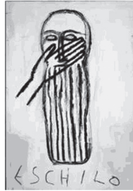
Eschilo M. Palladino Spadoni, op. cit. , p. 33

DE MARTINO, Francesco, «Next to nothing», SPhV 9 (2006), pp. 87-110.