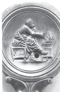
Ritratto di Euripide Lucerna Lipari, Mus. Arch. Reg. Eoliano inv. 9672 c Bernabò Brea, op. cit. , p. 23, fig. 13