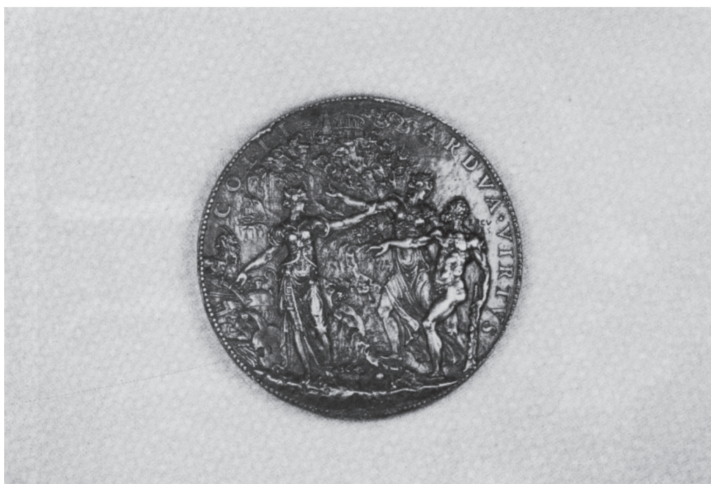
Ilustración 4: Medalla de Felipe II . (Reverso). León Leoni. Museo Lázaro Galdiano. Madrid.