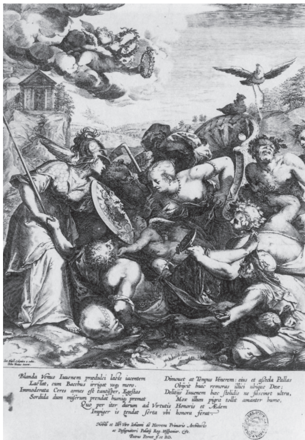
Ilustración 5: Homenaje a Herrera . Grabado de Perret. Biblioteca Nacional de Madrid.