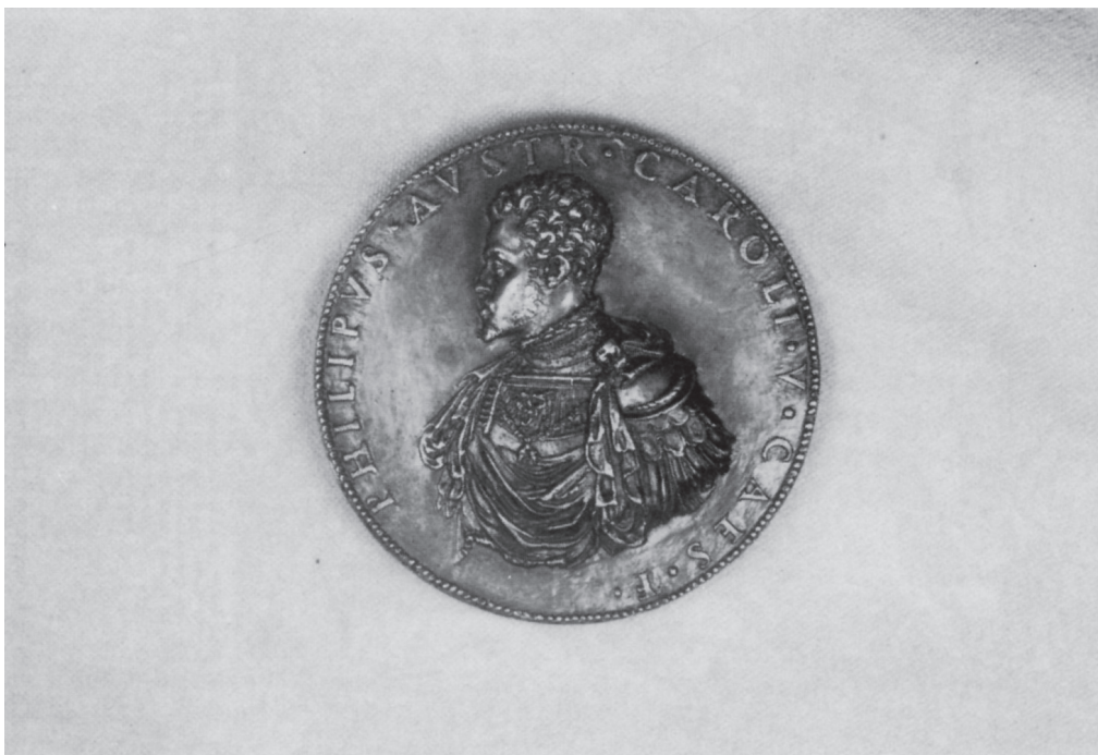
Ilustración 3: Medalla de Felipe II . (Anverso). León Leoni. Museo Lázaro Galdiano. Madrid.