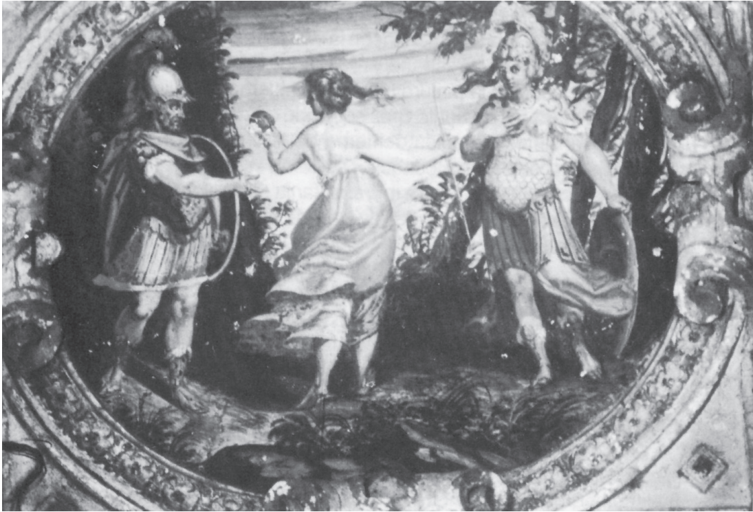
Ilustración 1: Elección entre el Vicio y la Virtud . Escalera del palacio de El Viso del Marqués (Ciudad Real).