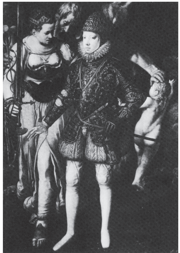
Ilustración 6: Retrato alegórico de Felipe III . Justus Tiel. Museo del Prado.