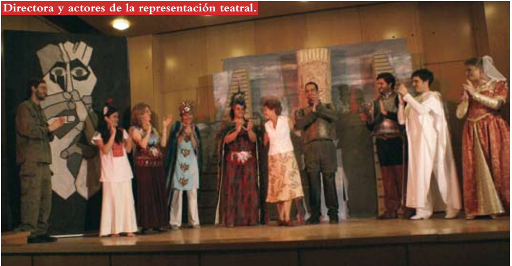
Directora y actores de la representación teatral.

de Los dioses se han fatigado contribuyan al mejor conocimiento de quien es uno de los más destacados nombres de la literatura reciente en La Rioja.