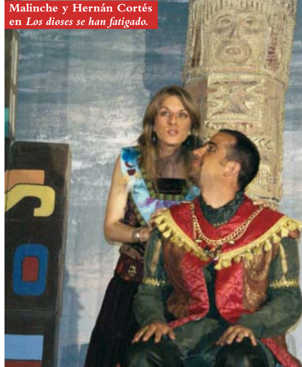
Malinche y Hernán Cortés en Los dioses se han fatigado .

de Los dioses se han fatigado contribuyan al mejor conocimiento de quien es uno de los más destacados nombres de la literatura reciente en La Rioja.