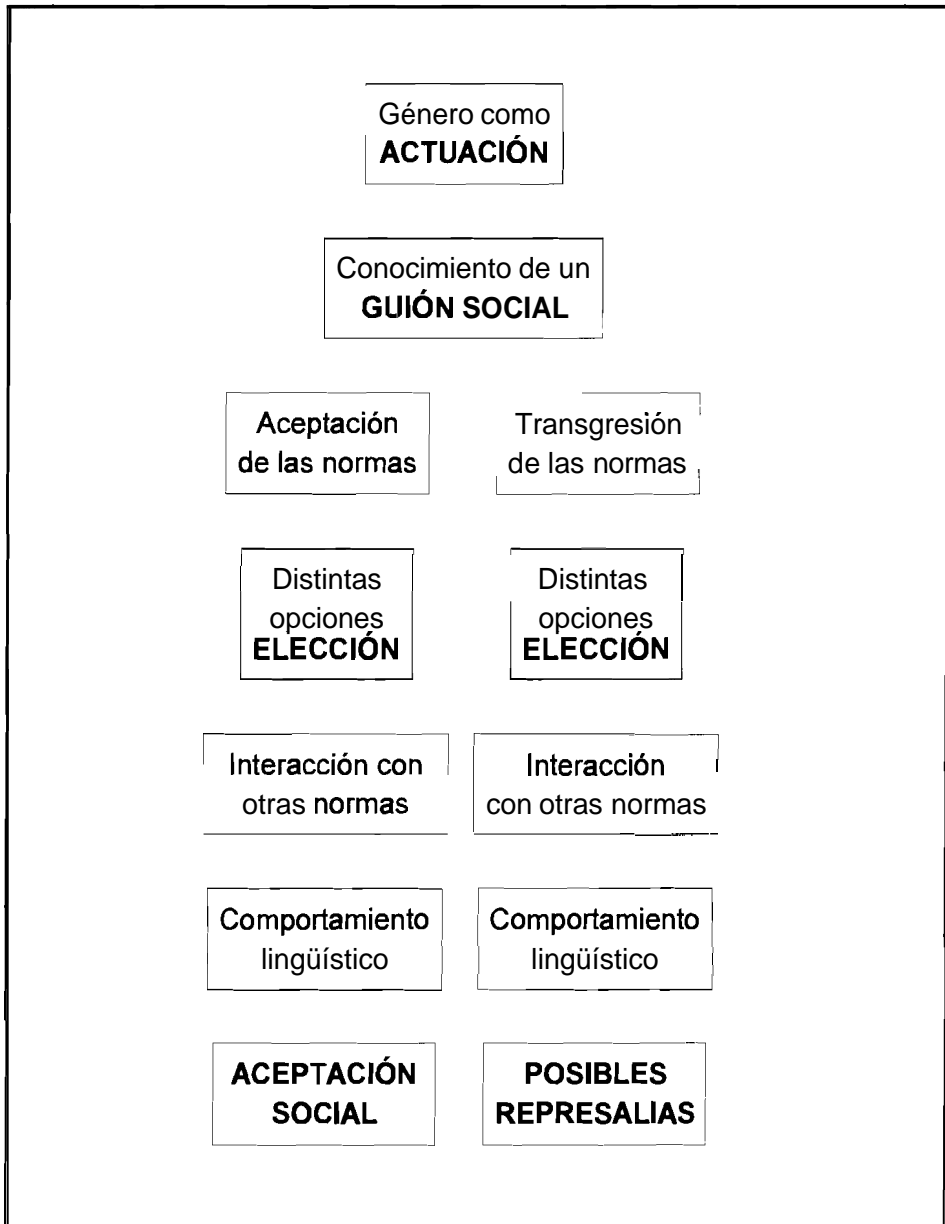
Figura 3. Representación esquemática de un modelo performativo de interpretación de las diferencias genéricas.